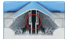
Abb. 10 mm Platten