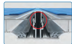
Abb. 16 mm Platten

Ausführliche Verlegeanleitungen und Videos sind abrufbar unter www.scobalit.de Auf Wunsch senden wir Ihnen diese auch gerne zu.